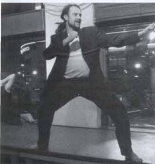
Experimentálne divadlo vo Viedni Fleischerei

Napriek všetkému zainteresovaní viedenský divadelníci dúfajú a veria v lepšiu budúcnosť kultúry ako takej... Veď uznajte sami, k čomu by sme sa mali v živote utiekaf, čo tvorí našu červenú niť, čo nás inšpiruje do ďalších krokov, ak nie naše sny, predstavy a vízie... Divadlo nám spolu s ďalšími kultúrnymi podujatiami podáva pomocnú ruku, ktorú by sme nemali odmietať. Neochudobňujme sa o experiment... Veď život je ako scenár divadelnej hry – záleží len na nás, ako si to zinscenujeme. ■